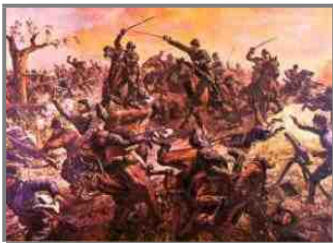
Pozzuolo del Friuli, 1917 – carica del "Novara" e del «Genova»

A commemorare questa sola azione dei due Reggimenti di Cavalleria non basterebbe dedicare un volume intero.