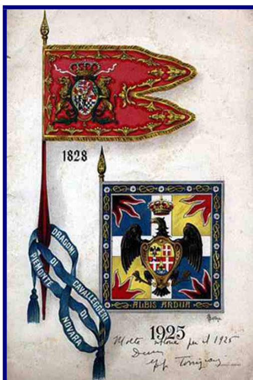
Stendardo e drappella dei "Lancieri di Novara"