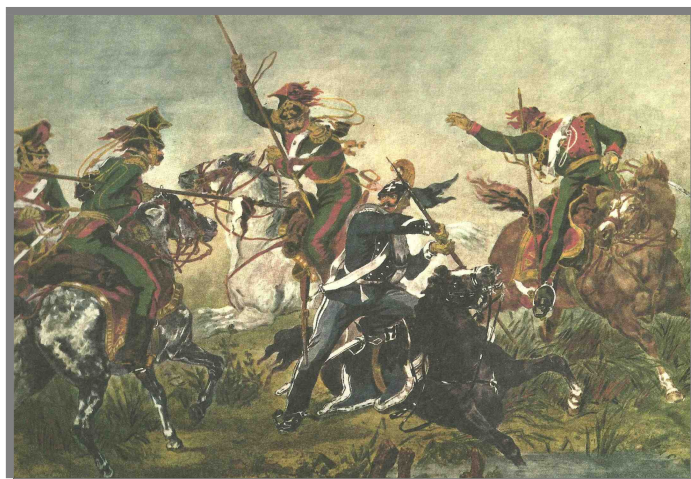
Il Brigadiere Fiora a Mortara - 1849

Il Reggimento partecipò a tutte le campagne risorgimentali: 1848-1849 (S. Lucia di Verona, Villafranca, Palestro e Novara), 1856 (Crimea), 1859 (Casteggio e Montebello), 1860-1861 (Castelfidardo e Macerone) e 1870, distinguendosi particolarmente per le sue brillanti cariche a Montebello (M.B.V.M.).