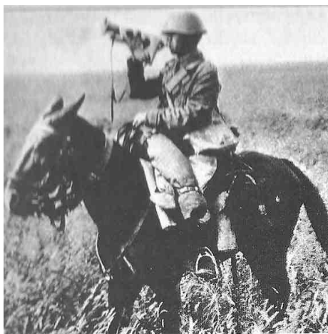
Tromba dei «Lancieri di Novara»

La situazione dell'8 a sul "Placido" fiume russo era agosto. In previsione Armate "B" aveva rigida sulla riva meridionale profondità con ostacoli minati e forti unità di disperata scarsità di effettivi tanto esteso rendeva però strategica puramente virtuale, sostanzialmente a rimanere prima linea con alle spalle il