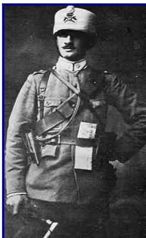
Il Capitano Augusto Moroder dei "Lancieri di Novara" 5° durante la Grande Guerra

29 e 30 ottobre, riuscendo però ad arrestare per due giorni, a prezzo di forti perdite, l'avanzata austriaca 10 .