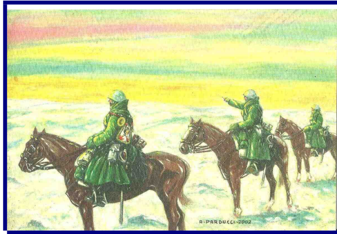
Pattuglia di "Lancieri di Novara" - Russia 1942 Da una cartolina militare