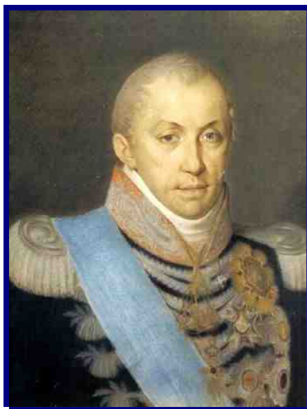
Re Carlo Felice di Savoia, fondatore nel 1828 dei "Dragoni di Piemonte", i futuri "Lancieri di Novara"

I noti fatti insurrezionali del marzo 1821 stravolsero però l'aspetto e l'ordinamento di tutta la Cavalleria sarda, poiché ben tre reggimenti, «Dragoni del Re», «Dragoni della Regina» e «Cavalleggeri del Re», passarono in parte agli insorti e vennero perciò sciolti d'autorità 9 . In conclusione, alla fine del 1822, dopo la formazione del nuovo Reggimento «Dragoni del Genevese» con una parte degli uomini delle unità soppresse, la Cavalleria sarda contava di 1 Reggimento di Cavalleria pesante, 2 di cavalleggeri e 2 di dragoni. Nel 1828, come sappiamo, si sarebbero aggiunti a questa forza piuttosto esigua i «Dragoni di Piemonte». In tutto, nuovamente 6 reggimenti come nel 1815, 5.400 uomini e 4704 cavalli.