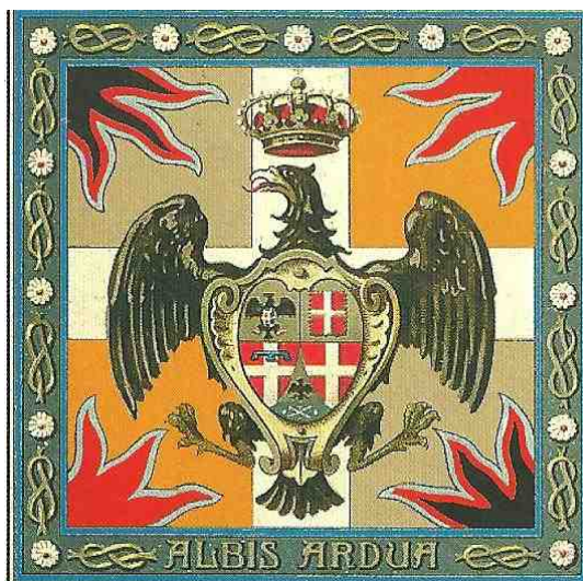
Lo Stendardo del Reggimento "Lancieri di Novara" 5°