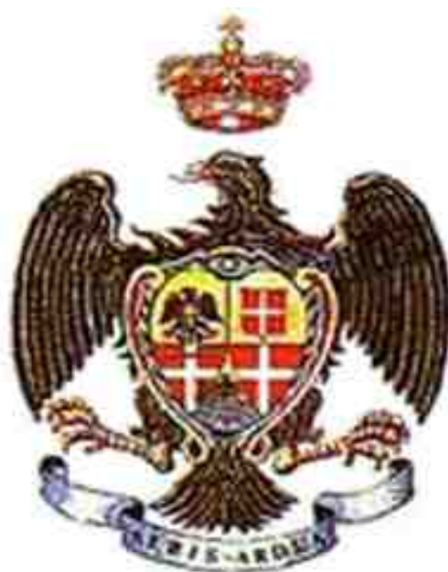
Stemmi araldico dei Lancieri di Novara 5°