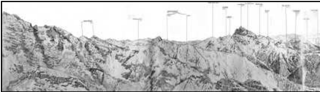
Schizzo panoramico del Monte Piana