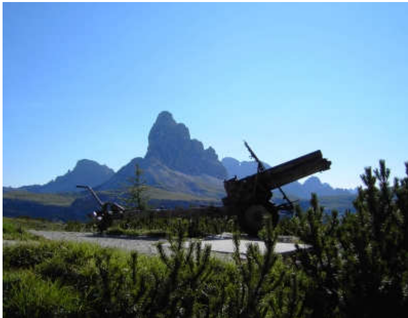
Museo all'aperto del Monte Piana