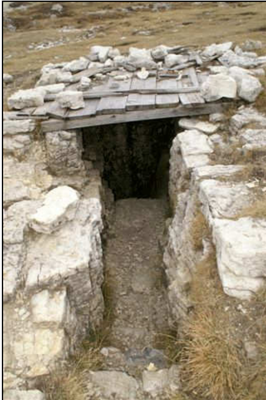
Museo all'aperto del Monte Piana