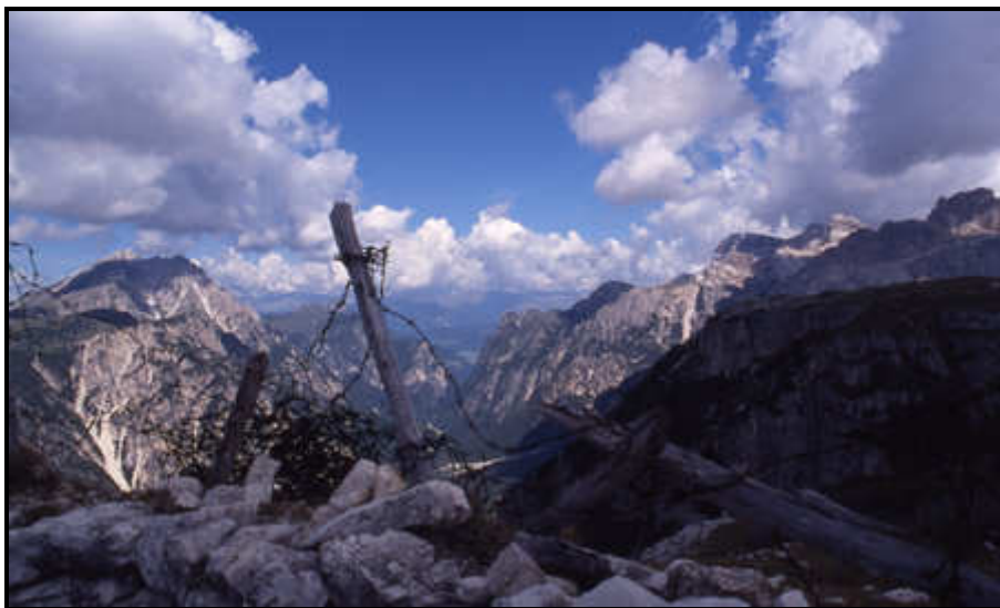
Resti di Trincea